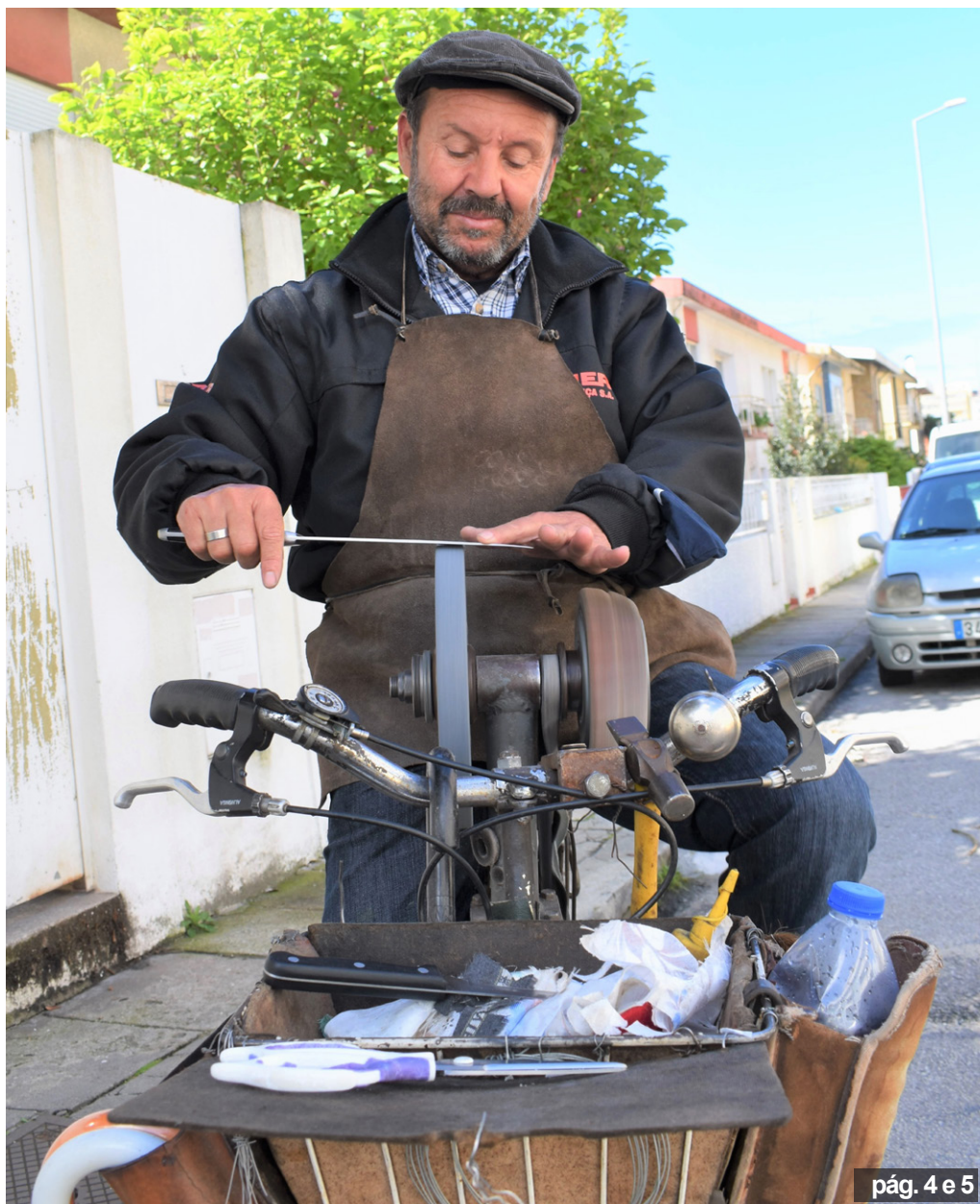
pág. 4 e 5