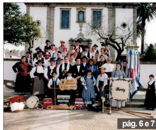
pág. 6 e 7