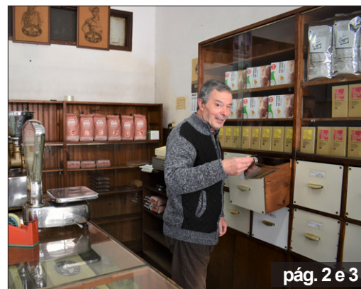
pág. 2 e 3