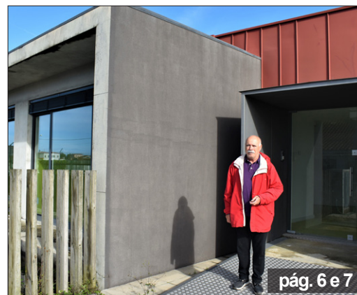
pág. 6 e 7