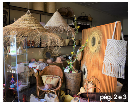
pág. 2 e 3