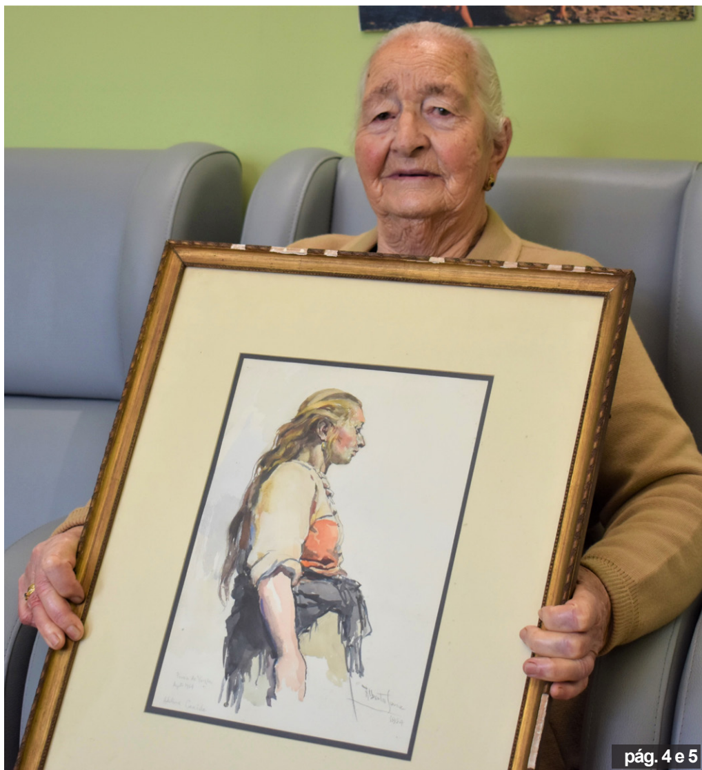
pág. 4 e 5